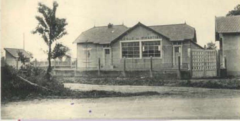
St Martial-sur-Isop (Ha Vienne) - Ecole de la Made